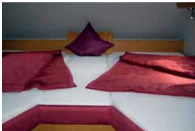
■ Das Alkoven-Längsbett des Phoenix 7500 RSL.

Längsbett trotzdem unter acht Meter Außenlänge bleibt. Preise ab 129.900,- Euro. Das Alkovenmodell 7500 RSL kommt mit einem „gedrehten“ Grundriss: Die Sitzgruppe befindet sich im Heck, Küche und Sanitärraum sind vorne zu finden, der Alkoven bietet Längsbetten an. Preis: ab 112.900,- Euro. ◀