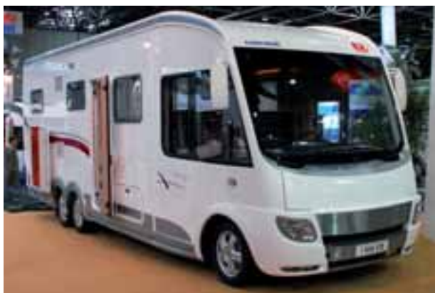
■ Euras neues Top-Modell: Die Vollintegrierten-Reihe Integra.