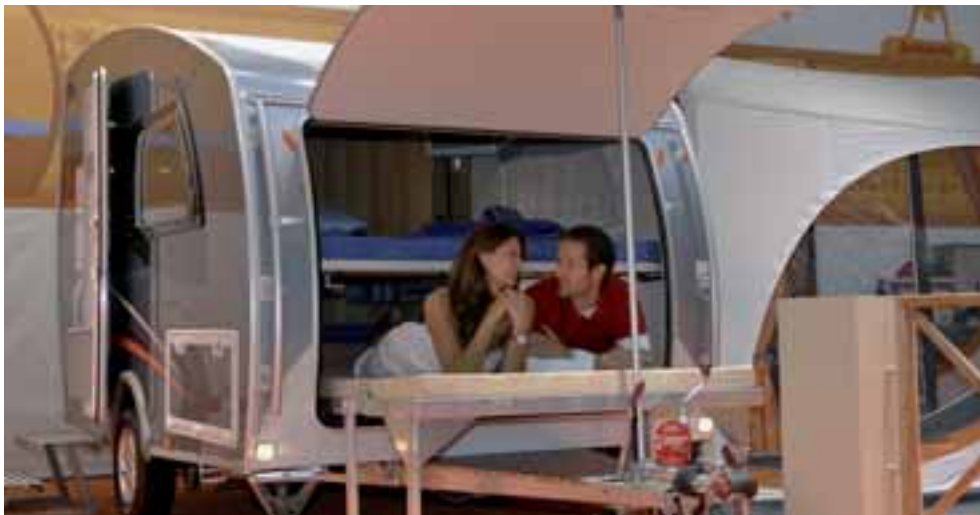
■ Eine weitere Studie zum Thema Campy wurde in Düsseldorf präsentiert: Im Campy Prototyp 2008 kann man das untere Bett nach draußen verlängern.

Küche. Möglich macht das der diagonal geschnittene Grundriss des Mini-Wohnwagens. Hervorstechendes Merkmal ist jedoch sein riesiger Stauraum unter dem Doppelbett im Bug, der ihn zum flexiblen Urlaubs-Aktivisten macht. Ob Wasserkisten, sperriges Sportgerät oder sogar zwei Fahrräder aufrecht stehend, hier findet alles Platz. Und ist leicht zu beladen über eine große, optionale Bugklappe, die weit nach oben schwingt. Der Preis für diesen „Basic Campy“ liegt bei 7.999,- Euro. Wer auf Heizung, Kühlschrank und Toilette nicht verzichten mag, sollte 1.782,- Euro für das Luxus-Paket investieren. ◀