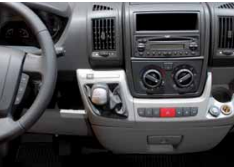
■ Starke Kombination: Das neue automatisierte Sechsganggetriebe und der Multijet 160 Motor des Fiat Ducato.

Fiat Professional verband seinen Auftritt auf dem diesjährigen Caravan Salon in Düsseldorf mit einer Weltpremiere: der Präsentation der Comfort-Matic. Hinter dem beziehungs-vollen Namen verbirgt sich ein automatisiertes Getriebe, das Schaltkomfort mit hoher Wirtschaftlichkeit verbindet und dem Fiat Ducato eine neue Antriebsdimension erschließt. Die Comfort-Matic wird ab Januar 2008 für den Fiat Ducato in Verbindung mit dem 116 kW (157 PS) starken Multijet Power-Diesel angeboten. Das neue