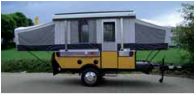
■ Falter fürs Gelände: Der Fleetwood Fold-Camper E 1 aus den USA.

Einer der erfolgreichsten Fold-Camper aus den USA ist jetzt auch in Deutschland erhältlich.