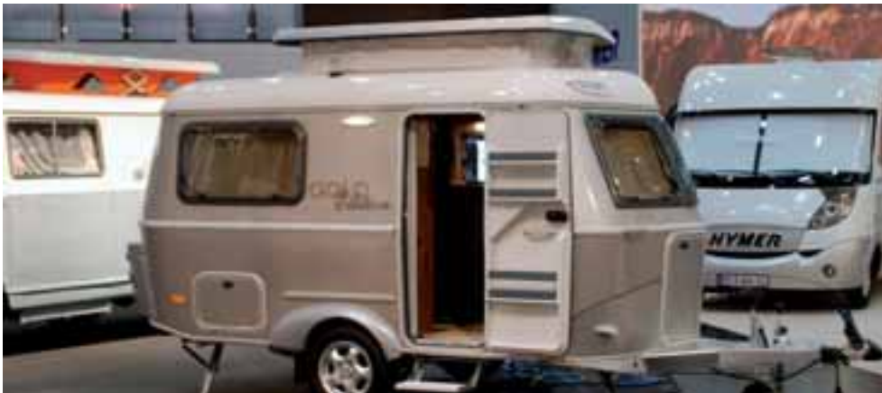
■ Eine Gold Edition ist nun auch für die Touring-Wohnwagenmodelle mit deutlichen Preisvorteilen erhältlich.

Die Reihe der Jubiläumsmodelle zum 50ten setzt Hymer mit den beiden Touring-Wohnwagen Familia 310 und Triton 430 GT fort. Beide Hubdach-Gold-Edition Modelle treten in Metallic-Champagner mit dem markanten Schriftzug Gold-Edition auf, innen wird die Stilwelt der übrigen Gold-Modelle fortgesetzt mit Möbeldekor Toscana Kirsche mit beige, passenden Stoffen und kompletter Ausstattung zu Sonderpreisen. ◀