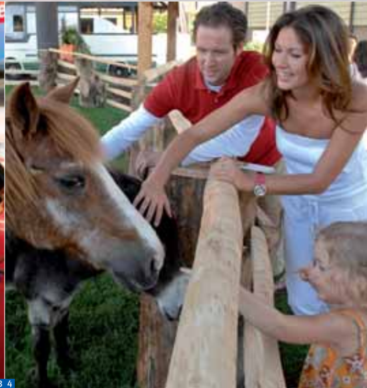
■ 1 Eine optimierte Hallenbelegung sparte den Besuchern Laufwege. ■ 2 Der Herstellerverband CIVD und der ADAC boten im Freigelände einen Einblick in moderne Sicherheitstechnik bei Gespannen an. ■ 3 Richard K. sorgte für Stimmung auf dem ANZEIGER-Stand. ■ 4 Kinder an die Macht: Die Kunden von morgen wurden erstmals mit vielfältigen Aktionen wie beispielsweise dem Streichelzoo beim Camping auf dem Bauernhof richtig Ernst genommen.