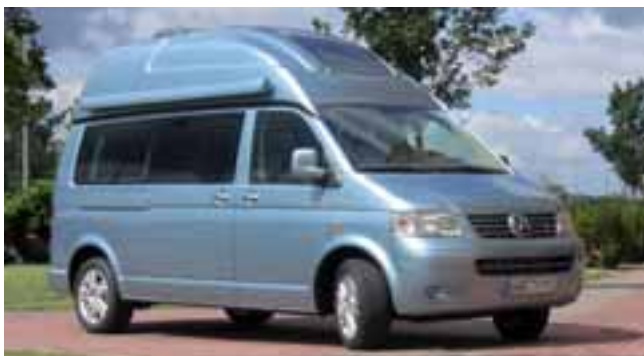
■ Seriennahe Studie für einen California mit Sanitärraum: Der VW California Ocean.

Es ist schon beinahe so etwas wie eine Tradition: kein Caravan Salon ohne eine California-Studie von VW: Mit dem California „Ocean“ könnten die Wolfsburger die California-Baureihe sinnvoll ergänzen, ein rund 40 cm längerer Radstand und ein Hochdach