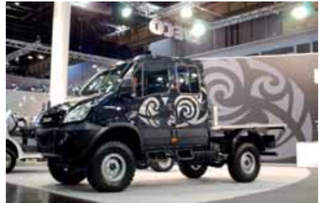
■ Für den harten Einsatz im Off-Road und Expeditionsbereich gedacht: Der neue Iveco Daily 4 x 4 an.

255/100R16 absolut expeditionstauglich. Den Daily 4x4 gibt es mit 3,5 t und 5,5 t zulässigem Gesamtgewicht sowie mit 130 kW (176 PS)-Dieselmotor. ◀