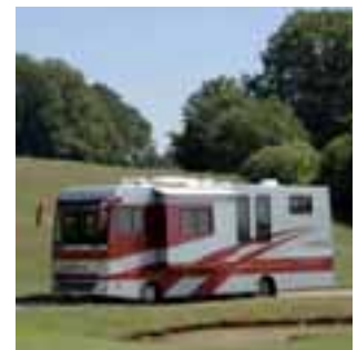
■ Mit dem Landsberg 900 bringt TSL ein Luxusmobil mit zwei Slideouts auf Basis des MAN TGL 10.210.

plätze, Ver- und Entsorgungsstation und eine 24 h-LPG-Gastankstelle runden den Neubau ab. ◀