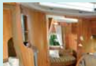
Allegro 97 Polsterstoff Formosa

Mit 4 verschiedenen Varianten bietet Allegro, der Luxus-Teilintegrierte von Chausson, jedem seinen Traumurlaub. Ob Garage mit El. Höhenverstellung, Einzelbetten mit großem Heckbad, separater Schlafraum oder französisches Bett mit großer Küche, alle haben ein tolles Preis-/Leistungsverhältnis! Der Allegro macht den Unterschied!