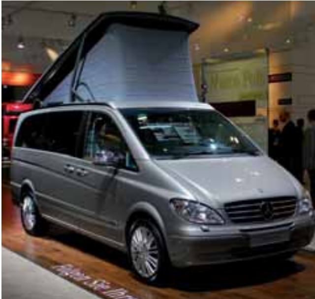
■ Der Viano Marco Polo Limited Edition mit umfangreicher Serienausstattung läutete die Saison 2008 ein.

Anhänger oder an der Anhängerkupplung gibt es keine Zusatzsensoren. Der Gewinn an Sicherheit und Komfort wird beim Einsatz über eine ESP-Warnleuchte in der Armaturentafel angezeigt. Die ESP-Anhängerstabilisierung zählt künftig bei allen Viano und Vito mit Anhängervorrichtung und Anhängerkupplung zum Serienumfang, beim Viano und Vito mit Allradantrieb 4MATIC ist die ESP-Anhängerstabilisierung grundsätzlich im Serienumfang enthalten. ◀