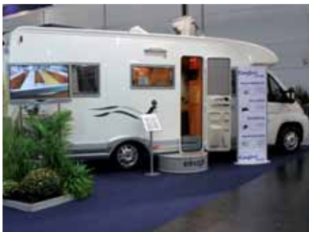
■ Konsequent ohne Gas autark: Der Elnagh Prince 520 L.

Ein komplett gasloses Reisemobil zeigte der italienische Hersteller Elnagh mit dem Alkovenmobil Prince 520 L. Bei Heizung und Warmwasser baut man bei der SEA-Tochter Elnagh auf die Webasto Kraftstoffheizung Dual-Top,