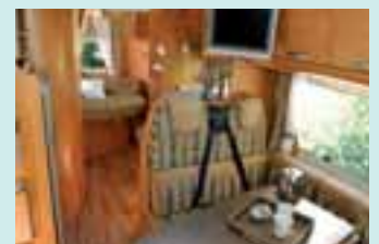
Chausson ist eine Marke von TRIGANO