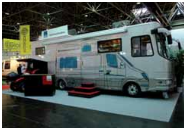
■ Neu auf dem Markt: Kubus baut Reisemobile individuell nach Kundenwunsch.

individuell aus, vom Kastenwagen bis zum großen Integrierten. Der in Düsseldorf gezeigte Integrierte überzeugte durch ein großzügiges Raumgefühl und einen gekonnten Möbelbau. ◀