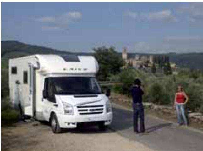
■ Die Laika Einsteiger-Baueihe X wird um einen großen Teilintegrierten X 696 R erweitert.

Bettversion trohnt über einer riesigen Garage, eine Halbdinette mit Seitenbank und ein Sanitärtaum mit separater Dusche sowie ein kompakter Küchenblock ergänzen die Einrichtung des 7.30 m langen Fahrzeugs. Der Laika X 696 R kommt ab 49.000,- Euro in den Handel. ◀