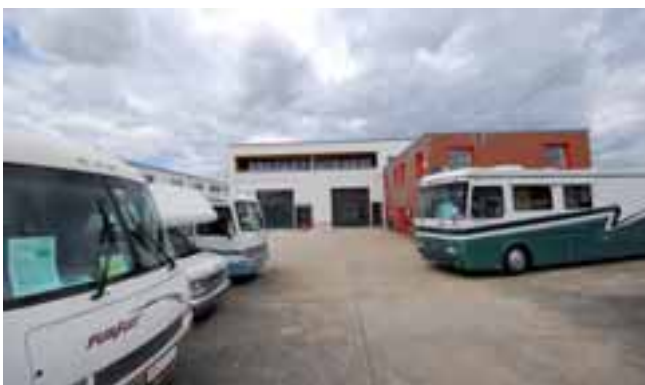
■ Die neue Produktionshalle von TSL in Swistal-Heimerzheim.

Nach 14 Monaten Bauzeit eröffnet TSL aus Swistal-Heimerzheim im Oktober 2007 die neuen Fabrikationsgebäude. Auf