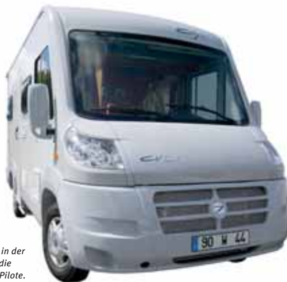
■ Kompakte Vollintegrierte in der Sechsmeterklasse bietet die neue Marke City Van von Pilote.

ausgestattet sein. Er wird als eigenständige Reisemobilmarke innerhalb der Pilote-Gruppe geführt und geht zunächst in zwei Längen (CV 57, 5,68 m / CV 60, 6,00 m) mit vier Grundrissvarianten (G, L, P und H) an den Start. Preise: deutlich unter 50.000,- Euro. Infos: www.cityvan.fr ◀