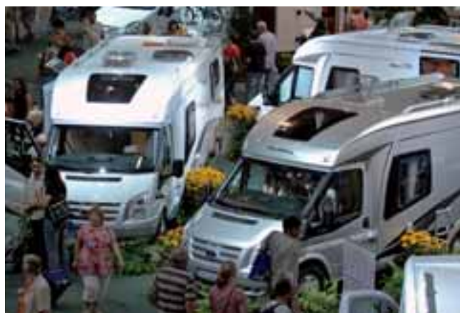
■ Massiv umlagert: Mit dem Van Exclusive bekommt die neue Van-Reihe von Hobby Zuwachs.

den Van Exclusive geben, die sich nur im Heck unterscheiden: Eine klassische Version mit Heckbett quer über der Garage (ab 41.550,- Euro) und eine Einzelbett-Längsversion (ab 42.650,- Euro). Die Alkoven Top-Reihe Sphinx kommt in der Saison 2008 nur auf Basis des Iveco Daily, die Ducato-Alternative entfällt. Dafür wird das Grundrissangebot um die Variante I 770 AK GWMC (Doppelbett Alkoven und festes Heckbett quer über Garage) erweitert. ◀