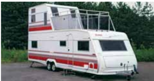
■ Der Hacienda Royal Tower dürfte der höchste Caravan Europas sein.

Nachdem der schwedische Hersteller wintersicherer Wohnwagen mit einem der längsten Cara-