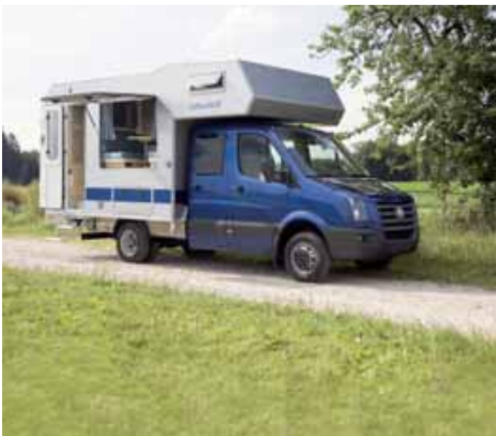
■ Bimobil bietet für den VW Crafter mit Doppelkabine eine Absatzkabine an.

sierenden Studie sind klar: Geringeres Gewicht, günstige Aerodynamik und ein ungewöhnliches, aufregendes Design mit betont flacher Kontur. Der Entwurf des IDC ist so handfest, dass eine Serienproduktion des Bürstner Aero fest geplant ist und das Mobil zudem als Technologieträger wichtige Hinweise auf die Reisemobile der Zukunft geben kann. ◀