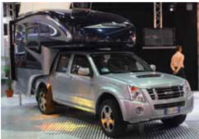
■ Schick designte Absetzkabine aus Italien: Der Mondo Pick Up.

Importeur und Händler werden noch gesucht für die neue Pickup-Kabine aus GfK, die rundum schick gestylt ist und mit einer kompletten Ausstattung aufwartet. Dem Zug der Zeit folgend ist sie gaslos ausgestattet,