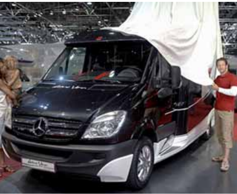
■ Aerodynamik und leichte Bauweise sollen beim Technologieträger Bürstner Aero Kraftstoff sparen.