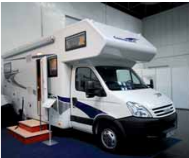
■ In der Preisklasse bis 80.000,- Euro tritt der neue Alkoven der Credo-Baureihe von Concorde an.

7,35 m und 7,79 m) und mit vier Grundrissen gibt es den Teilintegrierten. Den Innenraum zeichnen der neue Möbelbau mit Oberflächen in Echtholz furnier-Facetenschliff und gewichtssparender Bauweise ebenso aus wie das Bi-Color-Design: Möbelkörper aus dunklem Nussbaum kontrastieren mit Klappen in hellem Ahorn. Weitere News: Alle Concorde-Reisemobile sind ab sofort mit Elektro-Autark-Paket mit Efoy-Brennstoffzelle zu haben. Im Paket kommen eine Efoy 1600-Brennstoffzelle inklusive M10 Tankpatrone sowie ein 120-W-Solarpanel plus Mastervolt Kombi-Ladegerät zum Einsatz. Paketpreis: 7.900,- Euro. ◀