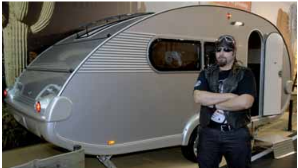
■ American Style im Retro-Look: Der T@b XL von Tabbert.

Nach dem T@b L erhält die kultige Retro-Knutschkugel T@b von Tabbert eine weitere Verstärkung im Premiumbereich. Der neue T@b XL kommt als Tandemachser wie sein Vorgänger, hat aber eine Diner-Version in amerikanischem Stil sowie Sanitärraum im Bug und ein zum Bett umbaubares Sofa im Heck.. Der komplette Möbelbau dazwischen ist im kultigen US-Retro-Look gehalten. ◀