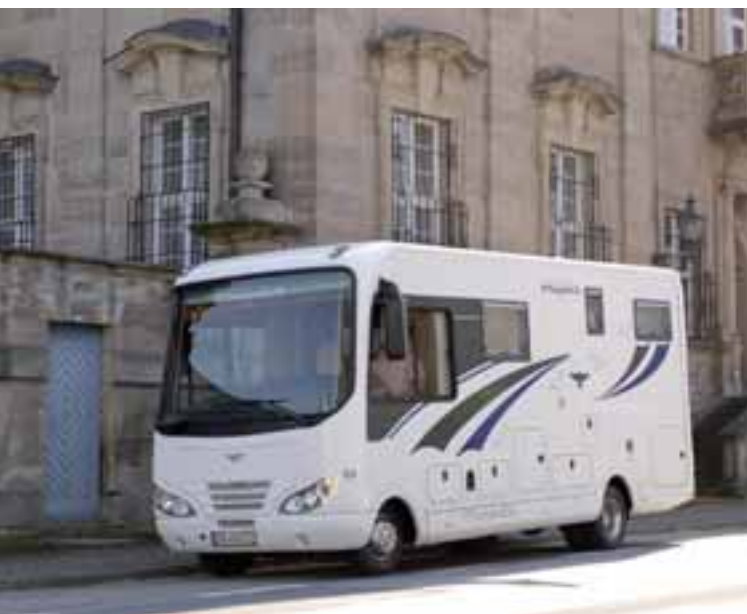
■ Die Phoenix Liner der Serie 7000 kommen mit neuen Grundrissvarianten in die neue Saison.

Der Aschbacher Hersteller Phoenix hat seine Reisemobile mit Smartgarage auf Basis des MAN