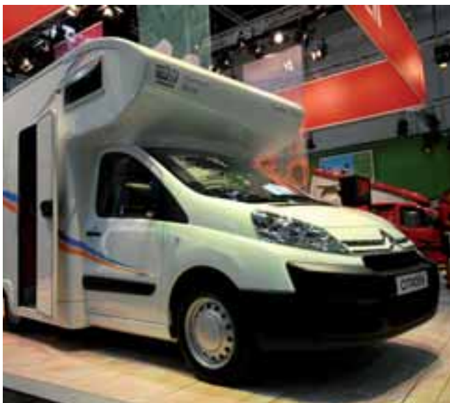
■ Das erste Alkoven-Reisemobil auf Basis des Citroën Jumper: Der Eberhardt Xantos 560.

Gut über 60.000,- Euro kostet ein neues kleines Alkovenmobil auf der Basis des neuen Citroën Jumpy, gebaut von Eberhardt-Reisemobile aus dem thüringischen St. Gangolf und in Düsseldorf zu besichtigen auf dem Stand von Citroën. Das Unternehmen fertigt neben Serienausbauten für Kastenwagen auch individu-