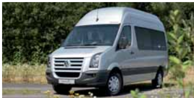
■ Nach zwölf Jahren wieder da: Der Sven Hedin von Westfalia Van Conversion auf VW Crafter.

de. Preis: ab 45.000,- Euro. Der Transit Big Nugget wird ab 2008 als Sonderausstattung ein neues Dachbett im Programm haben. ◀