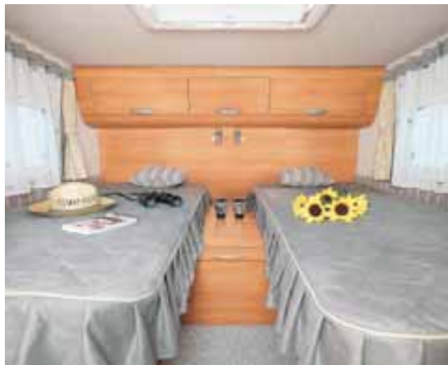
■ Schlafkomfort wie zu Hause: Der Coral S 660 SL mit komfortablen Einzelbetten im Heck.