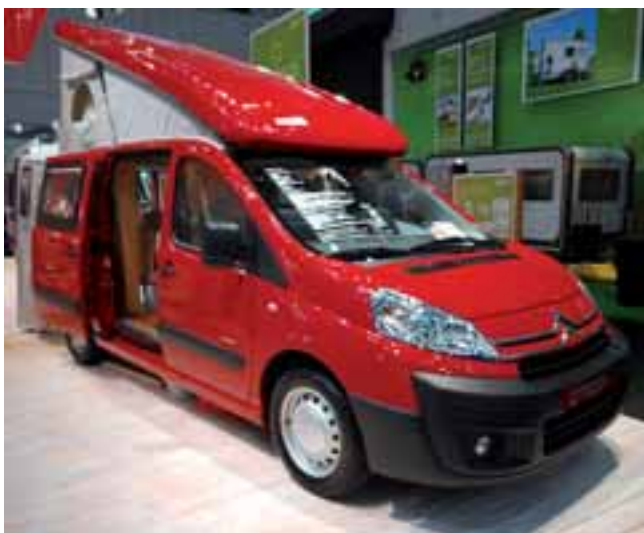
■ Mit dem Tati zeigt die Reisemobilmanufaktur Zoom einen witzigen Ausbau auf dem neuen Citroën Jumper.