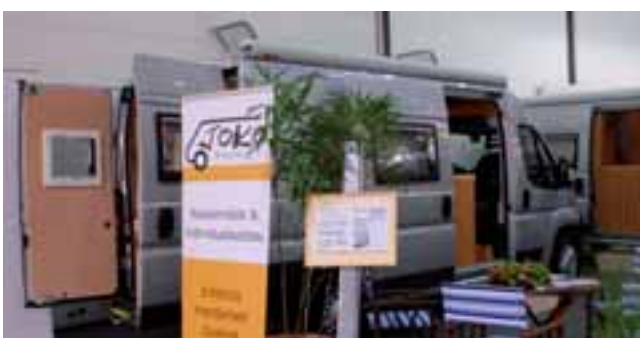
■ Handarbeit mit Echtholzausbau: Der Joko 480 auf Fiat Ducato.

Ganz auf natürliche Materialien ausgerichtet ist Joko mit den Modellen 420 und 480. Neben Korkparkett am Boden gibt es Möbel aus Sperrholz mit Echtholz furnier Erle, die Fronten aus Erle-Massivholzrahmen mit Sperrholzfüllung. Die Oberflächen sind geölt und gewachst, nur die Küchenarbeitsplatte und das Bad werden lackiert. Bei so