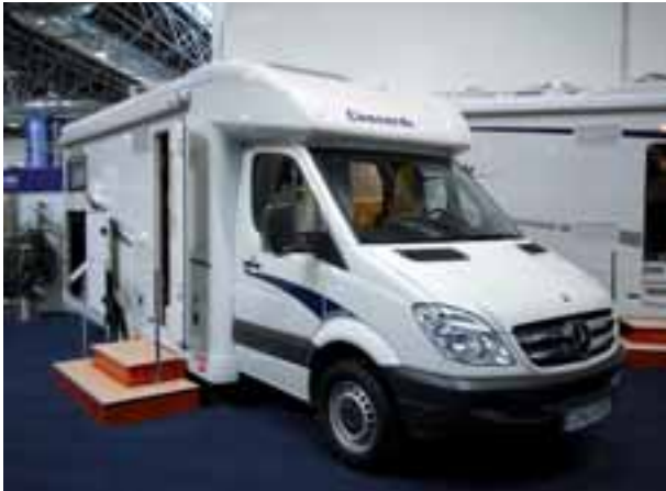
■ Den teilintegrierten Credo wird es in vier Längen mit vier Grundrissvarianten geben.

Sie haben im fränkischen Schlüsselfeld-Aschbach extra eine eigene Produktionshalle bekommen, die neuen Credo-Reisemobile von Concorde. Sie sollen das Modellprogramm nach unten abrunden: Als Alkoven, Integrierter und – erstmals in der Geschichte von Concorde – auch als Teilintegrierter. Preislich liegen die Credos zwischen knapp über 80.000,- und 100.000,- Euro, damit zielt der Credo etwa auch punktgenau auf die Integrierten der Hymer S-Klasse. Als Basisfahrzeug kommt der Mercedes Sprinter zum Einsatz, mit Ausnahme des Alkovenmodells, das auf Iveco Daily aufbaut. In vier Längen (6,75 m/7,19 m/