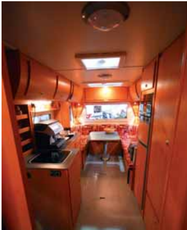
■ Ein gigantisches Raumangebot wie in einem Appartement herrscht im Wohnraum des Trail X.

Qualität im Fond ein Schlafzimmer mit riesigem Doppelbett, im Heck eine gemütliche Rundsitzecke. Clou an der Auflieger-Kombination ist die Tatsache, dass man das 6.5 t Gespann mit einem normalen Führerschein der Klasse B und dem Anhängerschein chauffieren darf. Der Auflieger Tischer Trail-X wird ab 65.000,- Euro erhältlich sein. ◀