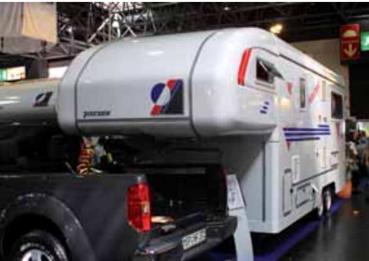
■ Mit dem Aufliegermobil Trail X baut Pick Up Spezialist Tischer ein besonderes Reisemobil.

Einen spektakulären Auflieger präsentierte Tischer Freizeitfahrzeuge auf dem diesjährigen Caravan Salon. Der knapp über sieben Meter lange Nachläufer wird mit einer Aufliegerkupplung auf der Pritsche eines gängigen Pick Up-Fahrzeuges montiert und beeindruckt durch seine gelungenen Proportionen. Er bietet in Tischer-üblicher