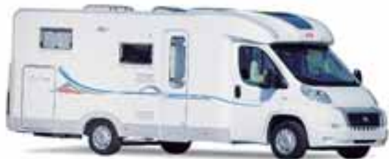
■ Mit kompakten Maßen und viel Luxus für Zwei: Der Adria Coral S 660 SL

im Heck aus. Das 7,20 m lange Mobil auf Basis des Fiat Ducato 130 kostet 52.899,- Euro. Sein kleinerer Bruder SP 660 SL kann alternativ dazu mit zwei groß ausgelegten Einzelbetten im Heck geordert werden. Preis: ab 51.999,- Euro. ◀