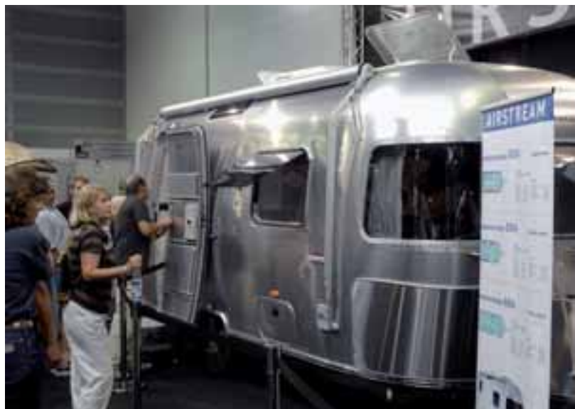
■ Publikumsmagnet: Der kultige Trailer aus den USA wurde vielfach bestaunt, wird er auch gekauft?

te baut Airstream außergewöhnliche Fahrzeuge, mehr als 60 Prozent aller je gebauten Airstream Wohnwagen sind immer noch im Einsatz. Und von den mehr als 400 Wohnwagen-Herstellern, die 1936 in den USA aktiv waren, existiert heute nur noch Airstream. Einer massenhaften Verbreitung dürfte in Deutschland der Preis entgegen stehen. Drei Modelle werden angeboten, alle keine Schnäppchen: Der Einstiegspreis für den „kleinen“ International 532 (Gesamtlänge 680 cm) mit zwei Schlafplätzen liegt bei 55.630,- Euro (Modell International 535: ab 58.390,- Euro, Modell International 684 ab 71.200,- Euro). ◀