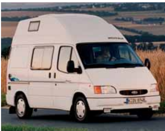
■ Steuer sparen: Ältere Ford-Nugget Reisemobile auf Basis des Ford Transit können umgeschlüsselt werden.

Ford hilft Besitzern älterer Nugget-Reisemobile beim Steuersparen. Begonnen wurde mit der Aktion auf dem Caravan Salon in Düsseldorf. Dort konnten Besitzer von Wohnmobilen auf Basis des Transit, die vor dem Jahr 2000 gebaut worden sind, kostenlos prüfen lassen, ob ihr Fahrzeug in eine günstigere Schadstoffklasse für die Kfz-Steuer eingestuft werden kann. Nach Angaben von Ford sind bis zu 160,- Euro Steuerersparnis pro Jahr möglich. Für die Überprüfung der Schadstoffklasse sind der Fahrzeugschein (bzw. Teil 1 der Zulassungsbescheinigung) und der Motorcode (engine code), der