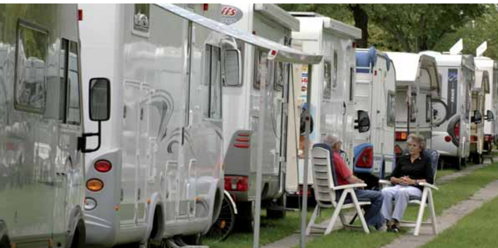
■ Wie immer Anziehungspunkt und Reisemobilmekka: Der Reisemobilpark auf dem Parkplatz P1.