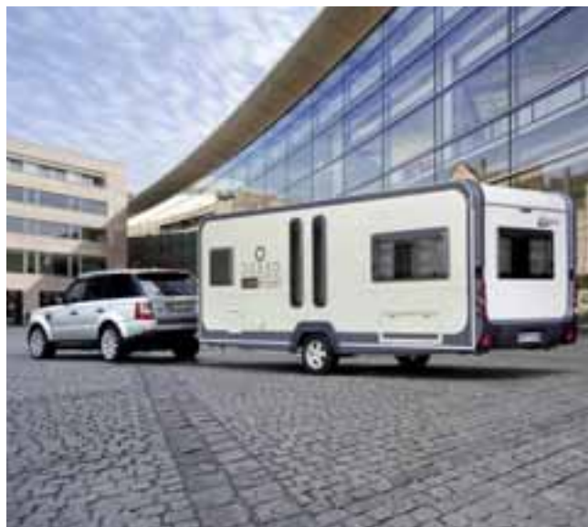
■ Mit dem Deseo Lifestyle rundet Eiffelland die erfolgreiche Deseo-Reihe nach oben ab.

Die erfolgreiche Deseo-Einsteigerbaureihe wird durch die Neuvorstellung Lifestyle ergänzt. Mit seinem durch und durch „anderen“ Innenraumkonzept wird er sowohl polarisieren als auch Duftmarken setzen. Gekonnte Innenarchitektur voll neuer Ideen verhilft dem Lifestyle zu einem ganz besonderen Raumerlebnis. Außen fällt die